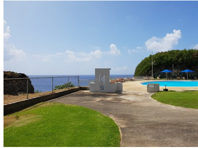
アガニア湾を望むプール