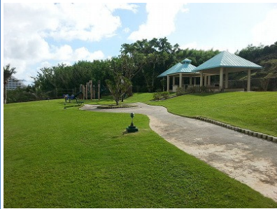
バーベキューデッキ