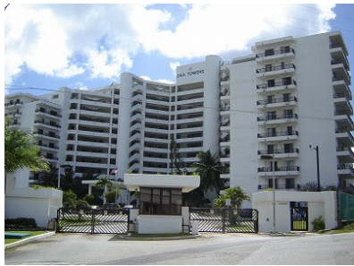
24時間有人セキュリティゲート